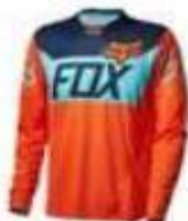
MAILLOT MANCHES LONGUES