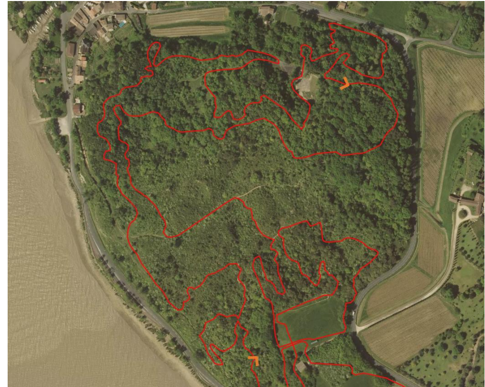
Détail du circuit dans le Mugron